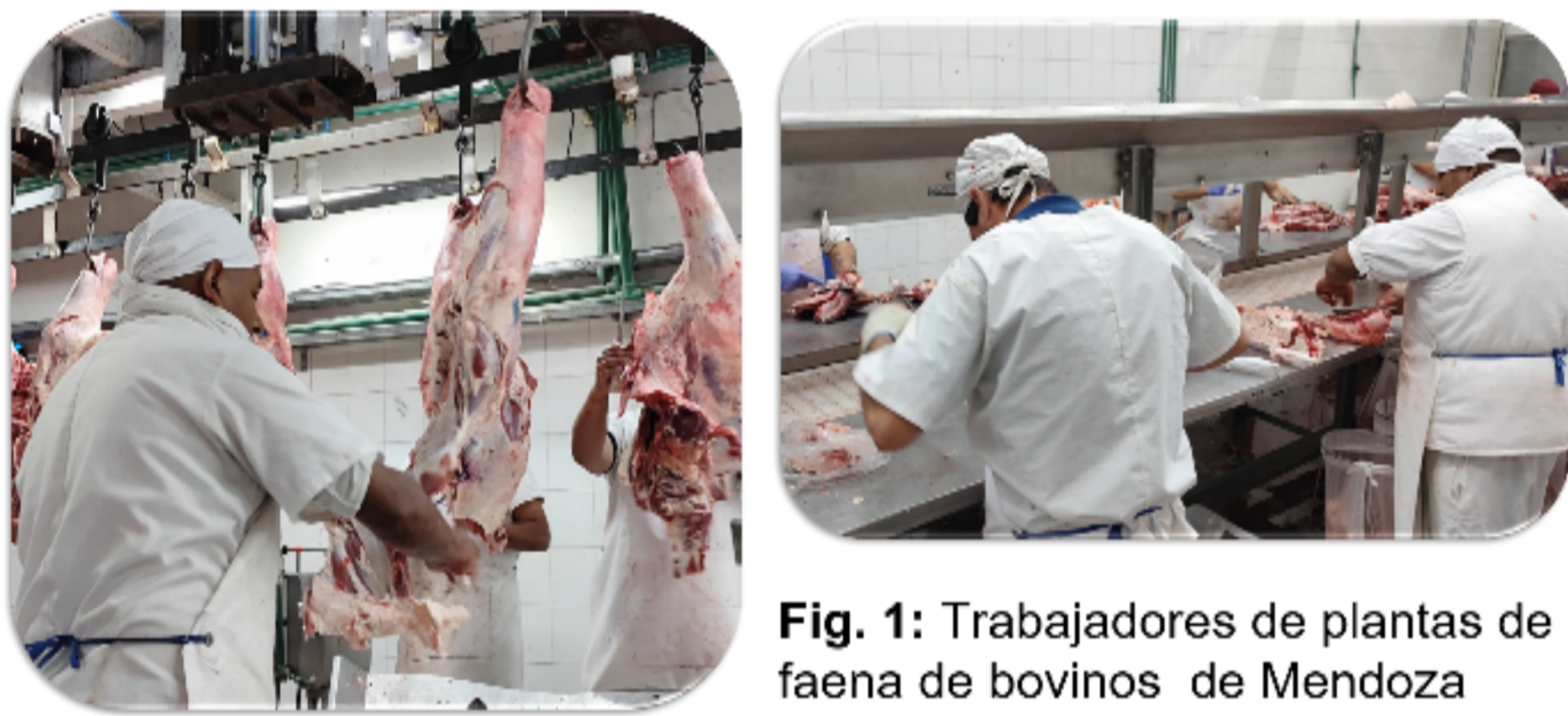
Fig. 1: Trabajadores de plantas de faena de bovinos de Mendoza

El objetivo del estudio fue conocer las percepciones de calidad de la carne bovina que tienen los trabajadores de frigoríficos.